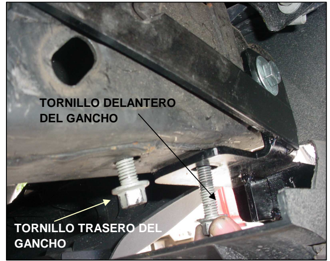
MODELO 4 X 4. FOTO LADO DEL PASAJERO.