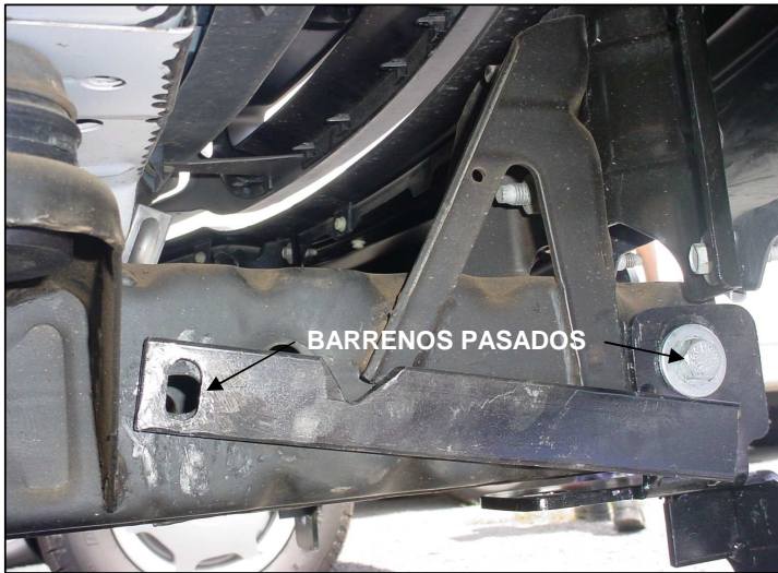
MODELO 4 X 2. FOTO LADO DEL PASAJERO.